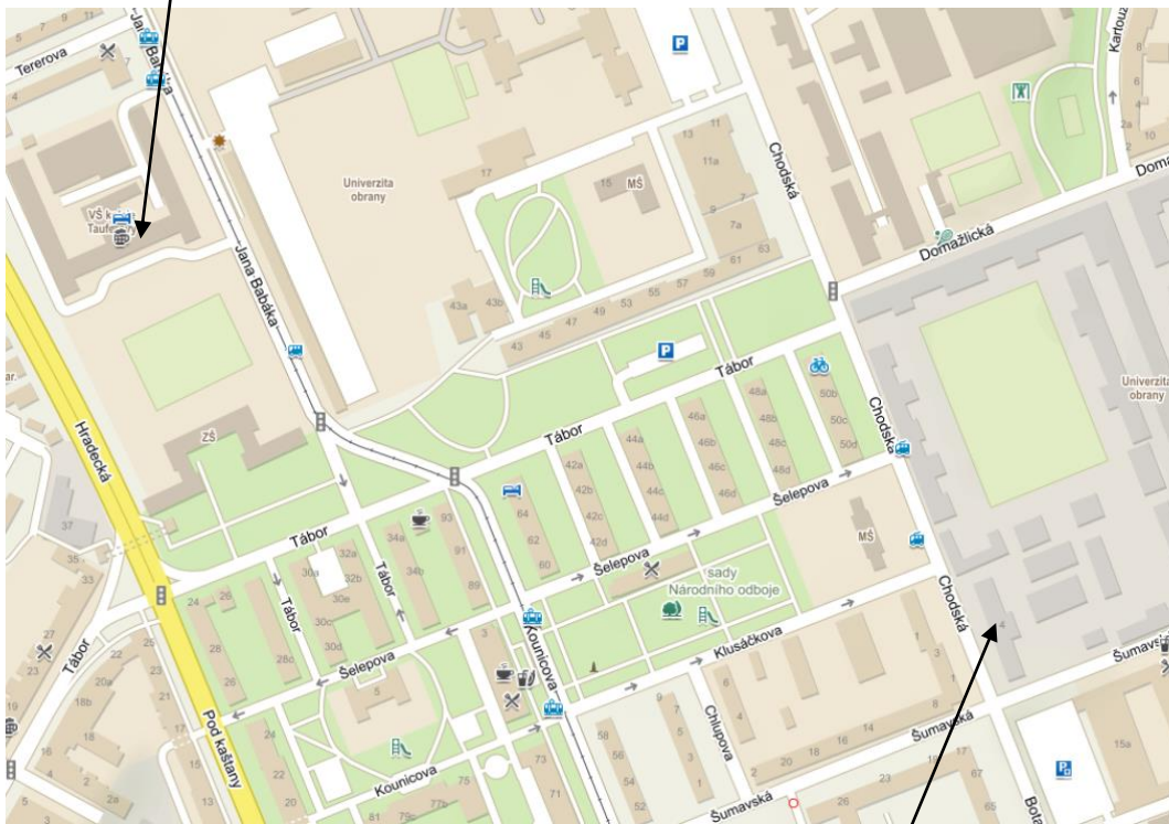
Klub Univerzity obrany (Šumavská 4)